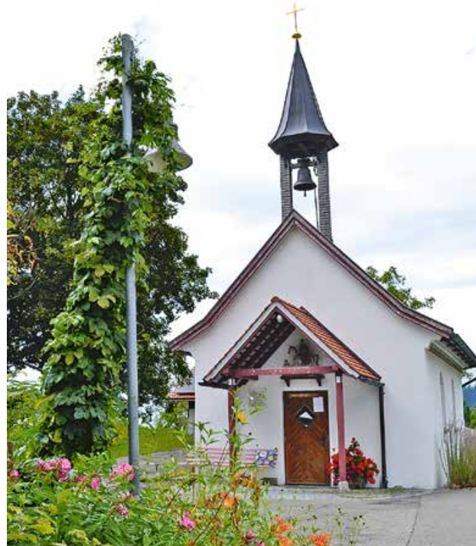
Kapelle St. Martin in Hopfen.

Anmeldungen bitte direkt im Artemisia: Telefon 08386/960510 E-Mail: veranstaltungen@artemisia.de