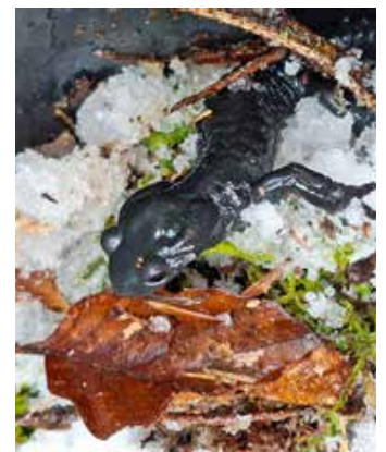
Im Bereich Kalzhofner Berg gefundener Alpensalamander.

Im Zuge der professionellen Suche, bei dem auch beteiligte Grundeigentümer und