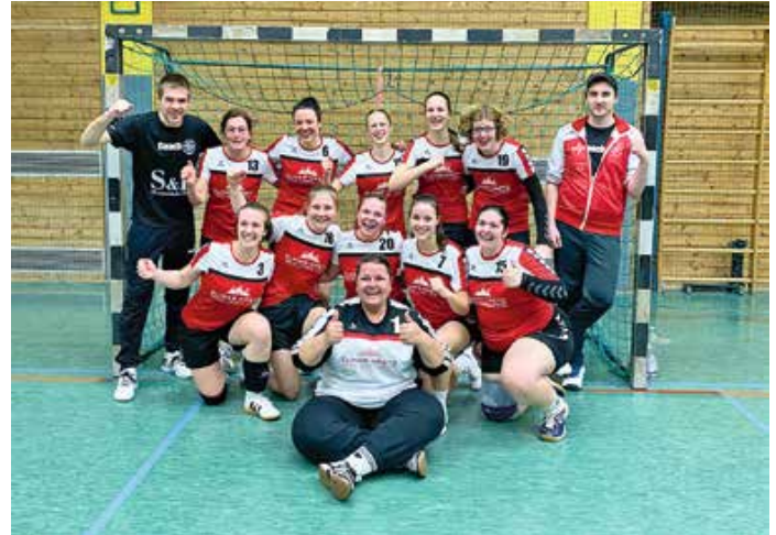
Die TSV-Handballerinnen feierten einen 33:22-Heimsieg gegen die HSG Dietmannsried/Altusried.

Erfolgsgeschichte an der Platte: Drei Jahre Tischtennis beim TSV Oberstaufen Was vor genau drei Jahren als ambitioniertes Projekt startete, hat sich mittlerweile fest in der Sportlandschaft von Oberstaufen etabliert: Die Tischtennis-Abteilung des TSV Oberstaufen feiert ihr dreijähriges Bestehen