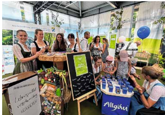
Studierende und Lehrkräfte der Fachschule für Ernährung und Haushaltsführung auf der Festwoche 2025.

- Abschlussprüfung Hauswirtschaft im Anschluss möglich bei entsprechenden Praxiszeiten