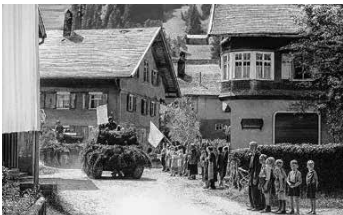
Abmarsch französischer Truppen in Thalkirchdorf, Juli 1945 Standbild aus der DW-Dokumentation Frauen als Kriegsbeute.

Wir freuen uns auf Ihren Besuch. Der Eintritt ist frei!