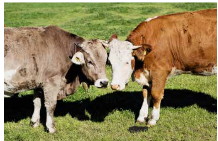
Ökologische Rindermast im Grünland.