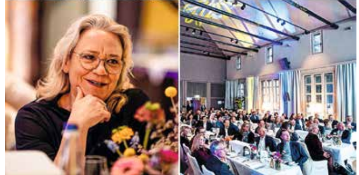
Eindrücke der diesjährigen Preisverleihung des ADAC-Tourismuspreis Bayern.