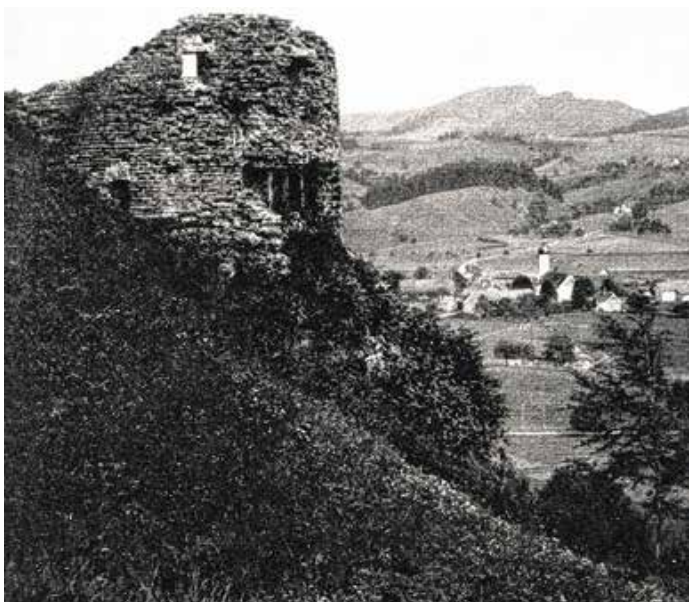
Ausstellung Ritterträume und Ruinen 2025 – Ringenberg bei Maierhöfen 1906.