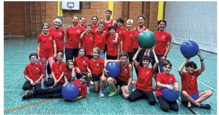
Neue T-Shirts und neue Medizinbälle gab es für die Leichtathletik-Abteilung dank des Sponsorings des Hotels „Dein Engel“ und des Bekleidungsgeschäfts „Hagspiel Moden“.

Das Team gastierte zum Hinrundenabschluss in Immenstadt bei der JSG Alpee-Grünt. Vor dem Spiel standen beide Teams punktgleich auf den Rängen 3 und 4. Die Staufner Mädels starteten furios ins Spiel und lagen nach elf Minuten mit 9:2 vorne. Vom zwischenzeitlichen Herankämpfen der Gäste ließen sich die Staufner Mädels in der Folge ebenso wenig aus dem Konzept bringen, wie von einigen Unsauberkeiten im eigenen Offensivspiel. So steht ein verdienter 29:19-Derbysieg, der den guten dritten Tabellenrang zur Winterpause sichert. Mit diesem Erfolg im Rücken startete das Team in die anschließende Weihnachtsfeier mit Essen und Bowling