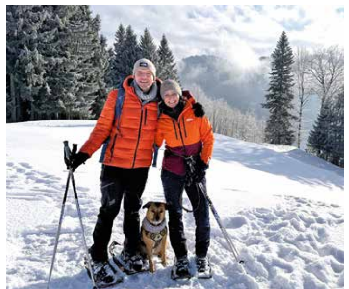
Auf geht's! Mit den Guides durch das Winterwunderland Oberstauften.

Farbe: grau melange Preis im Januar: 14,50 € (Normalpreis: 15,90 €) Dieser und weitere Artikel sind erhältlich in den Tourist-Informationen oder online unter oberstauften.de/shop .