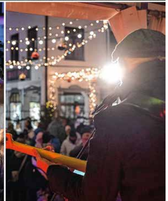
Eindrücke vom Oberstaufener Winterzauber 2025/26.