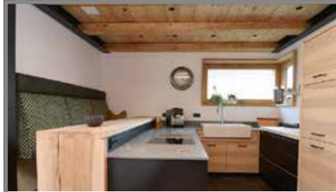
MASSGEFERTIGTE SCHREINERKÜCHE MIT BORA

Trauergespräche und Bestattungsvorsorge- Beratung, auf Wunsch auch gerne bei Ihnen zuhause.