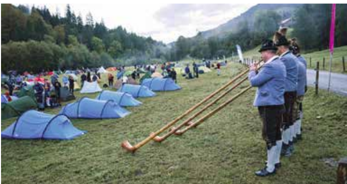
Der Weckruf der Alphörner – ein Highlight für die internationalen Teilnehmer:innen des letztjährigen Fjällräven Classics.