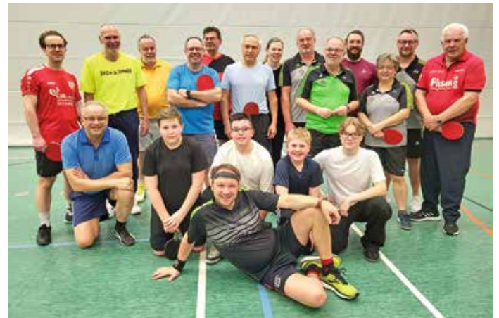
Die Tischtennis-Abteilung des TSV Oberstaufen begrüßte das befreundete Team aus Oberreute.

Die Tischtennis-Abteilung des TSV Oberstaufen begrüßte die Mannschaft aus Oberreute zum Rückspiel und erlebte ein tolles sportliches Gemeinschaftserleb-