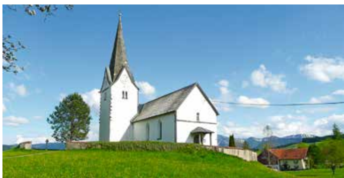
Kapelle St. Stephan in Genhofen.