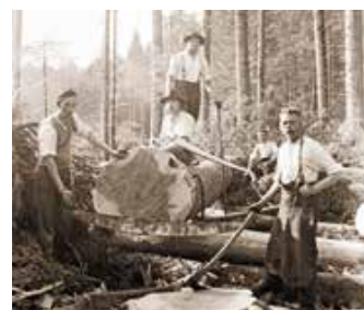
Holzarbeiter 1937 in Grünenbach.

Vortrag am Freitag, den 28. März, um 19.30 Uhr Manfred Fink, Archivar im Gemeindearchiv Oberstaufen hält einen spannenden Vortrag über die harte und gefährliche Arbeit der Holzarbeiter an den steilen Berghängen im Hochgratgebiet. Mit eindrucksvollen Bildern und einer Filmvorführung wird auch die Herausforderung des Holztransportes in die Sägewerke anschaulich dargestellt. Kommen Sie vorbei und erleben Sie eine faszinierende Reise in