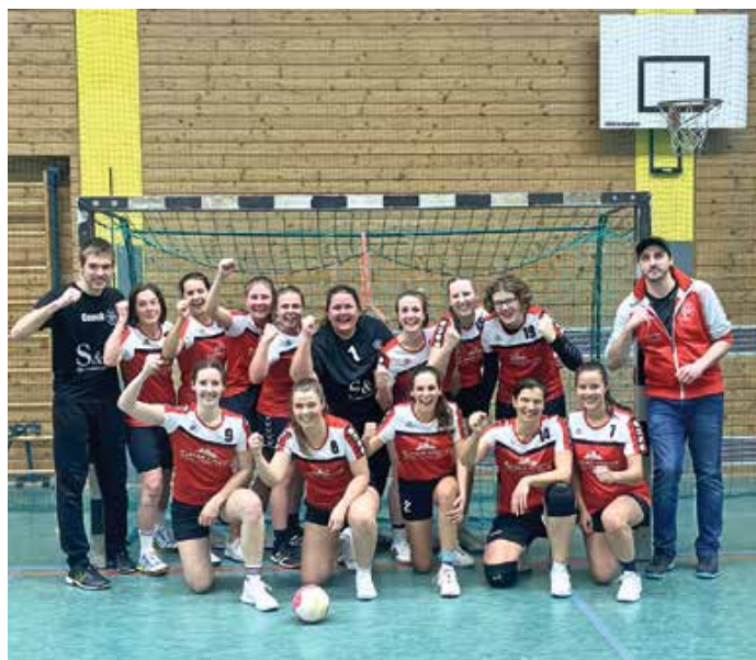
Die Handballerinnen des TSV Oberstaufen feierten ihren ersten Saisonsieg.

Damen: Die Damen empfingen die zweite Mannschaft des TV Immenstadt. Nach knapper Hinspielniederlage lautete das klare Ziel, nun den ersten Sieg vor heimischer Kulisse einzufahren. Der lautstarken Zuschauerunterstützung taten auch die teils schleppenden Offensivbemühungen beider Teams keinen Abbruch. Nach dem außergewöhnlichen 1:1-Zwischenstand nach 13 Spielminuten setzten sich die TSV-Damen zur Halbzeit mit 6:3 leicht in Front. Die Gäste kämpften sich jedoch wieder heran und gingen einige Minuten vor Spielende ihrerseits