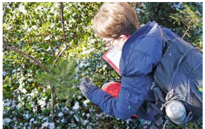
Auch die Kontrolle junger Bäume für eine Waldinventur gehört zu den Aufgaben der Freiwilligen.