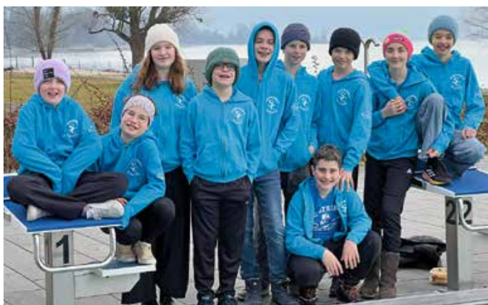
Jugendmannschaft des SC Steibis Team Aquaria.