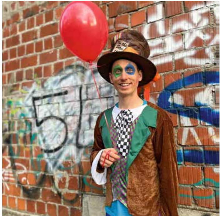
Der „Verrückte Hutmacher“ verzaubert Groß und Klein beim verkaufsoffenen Sonntag.