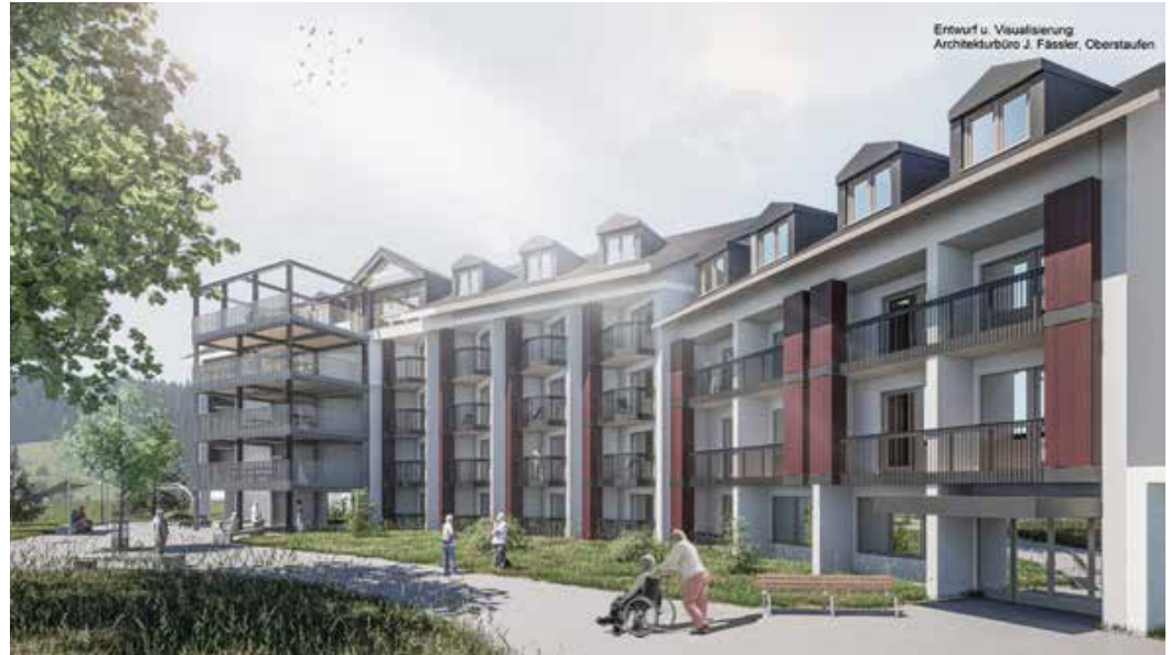
Außenansicht des Seniorenzentrums nach der Umbaumaßnahme

Wie vielen sicherlich bekannt ist, finden zurzeit große Umbaumaßnahmen im Seniorenzentrum St. Elisabeth statt. Gerne möchten wir an dieser Stelle über den aktuellen Stand informieren. In den letzten Wochen wurde der Aufzug im Seniorenzentrum saniert, sodass er jetzt im neuen Glanz erstrahlt. Als nächstes geht es nach den Feiertagen mit der Entkernung der sogenannten Strangzimmer weiter. Dies sind alle Zimmer mit der Nummer 10 / 11 / 12. Zukünftig sollen in diesem Bereich die Aufenthaltsräume mit den Balkonen sein. Die Bewohner*innen, die dort ihre Zimmer haben sowie deren Angehörige wurden bereits darüber informiert und ein Umzug innerhalb des Hauses hat stattgefunden.