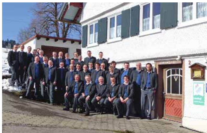
Männergesangverein vor dem Gründungslokal beim Kenner.