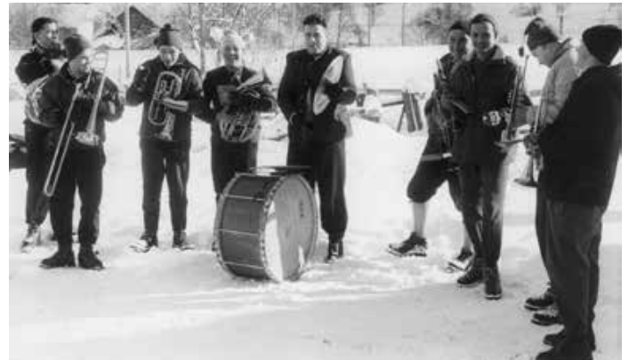
Steibinger Musikanten beim Silvesterblasen im Jahr 1960.