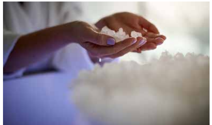
Mit den sinkenden Temperaturen beginnt wieder die perfekte Zeit für entspannte Saunabesuche im Erlebnisbad Aquaria.

2. Kaltes Wasser für die Haut: Im nächsten Schritt wird die Haut gekühlt, idealerweise mit kaltem Wasser aus einem Schlauch